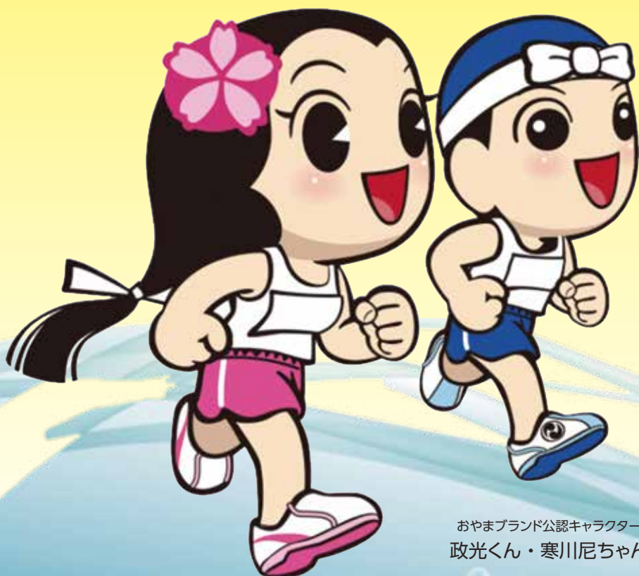
おやまブランド公認キャラクター 政光くん・寒川尼ちゃん